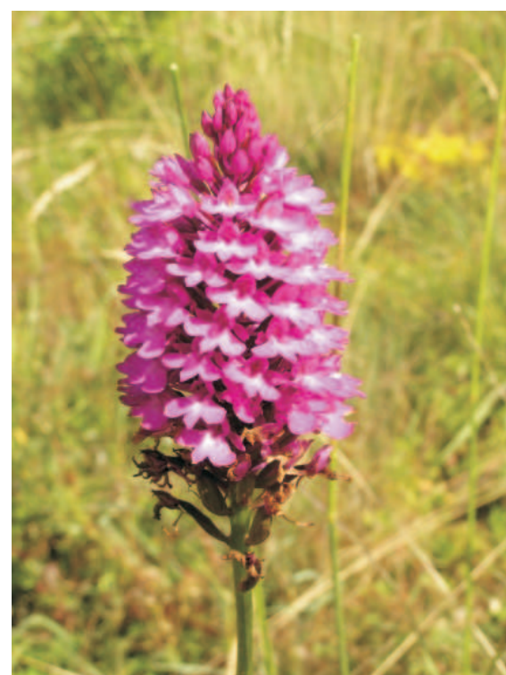
kriticky ohrožený včelník rakouský (vlevo) a vzácný rudohlávek jehlancový

Zvláštní pojmenování obce Srbsko vzniklo pravděpodobně na počátku středověku, kdy se tu usadili vystěhovalci srbské národnosti. Jestli se jednalo o obyvatele pocházející z Balkánu či Lužické Srby zajaté na počátku 11. století Boleslavem Chrabrým, s určitostí nikdo nedovede potvrdit. Nejstarší skutečná historická zmínka o obci se objevuje až roku 1428 v účtech hradu Karlštejna. Obyvatelé Srbska se v minulých staletích věnovali mimo zemědělství lovu ryb a obchodu s dřívím a dřevěným uhlím, které na vorech a lodicích dopravovali až do Prahy. Srbsko bylo vždy vhodným místem k přechodu řeky. Ještě donedávna zde sloužil jeden z nejnámějších přívozů na Berounce. 6. dubna 1936 ho využil i první československý prezident T. G. Masaryk.