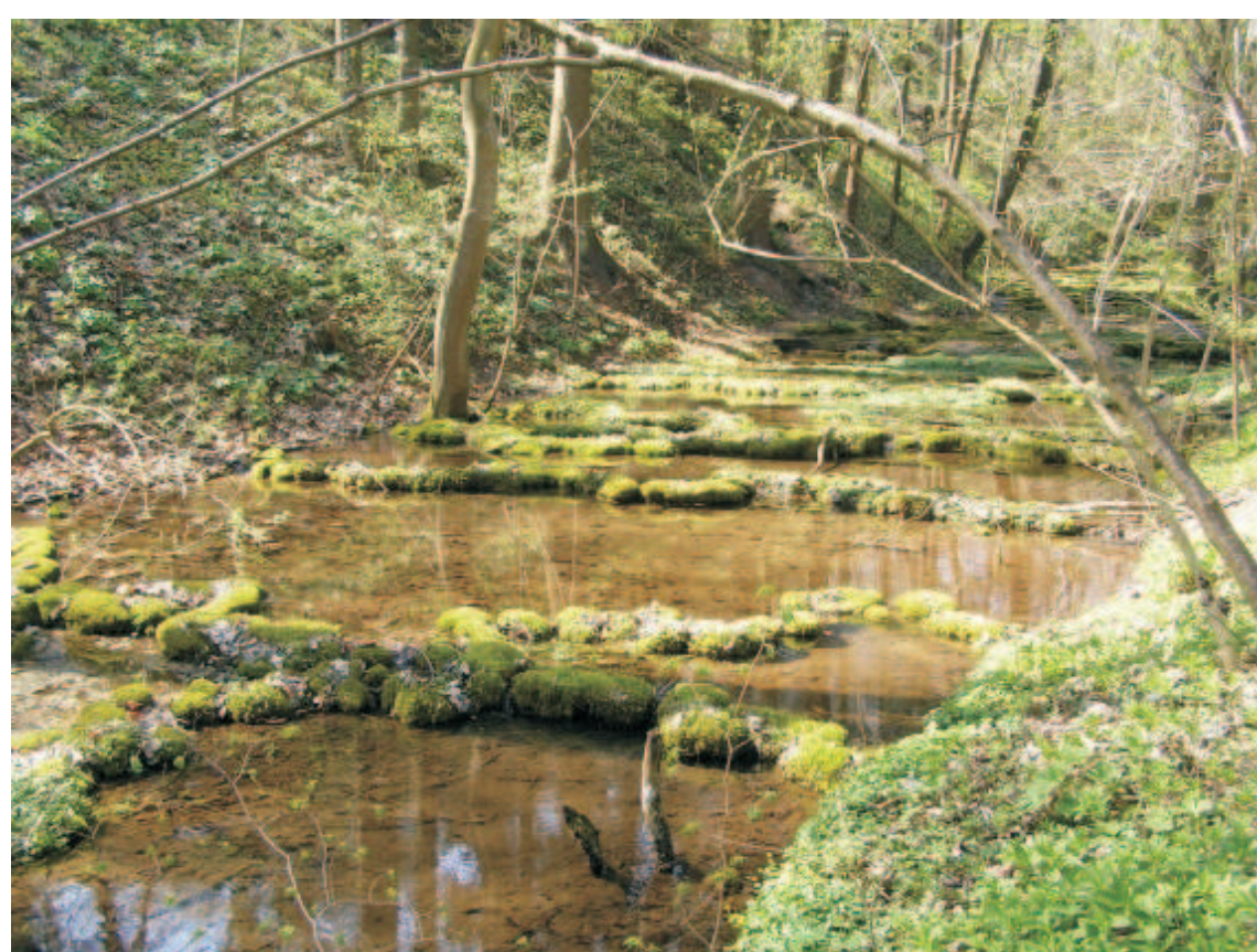
pěnovcové kaskády v Kodské rokli