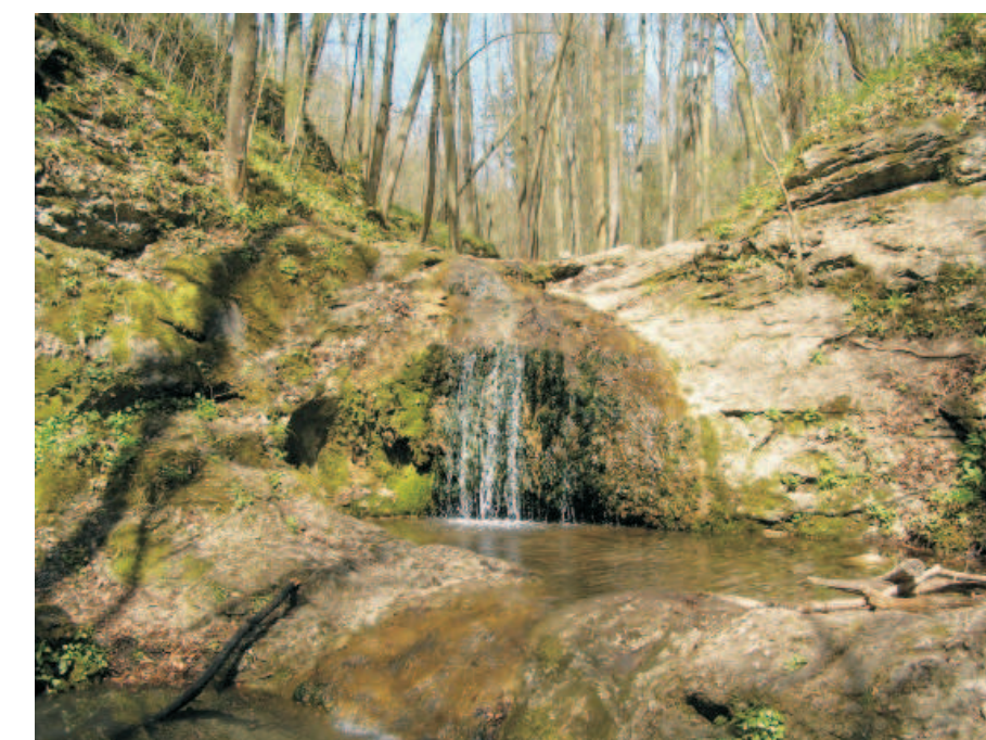
vodopády na Bubovickém potoce