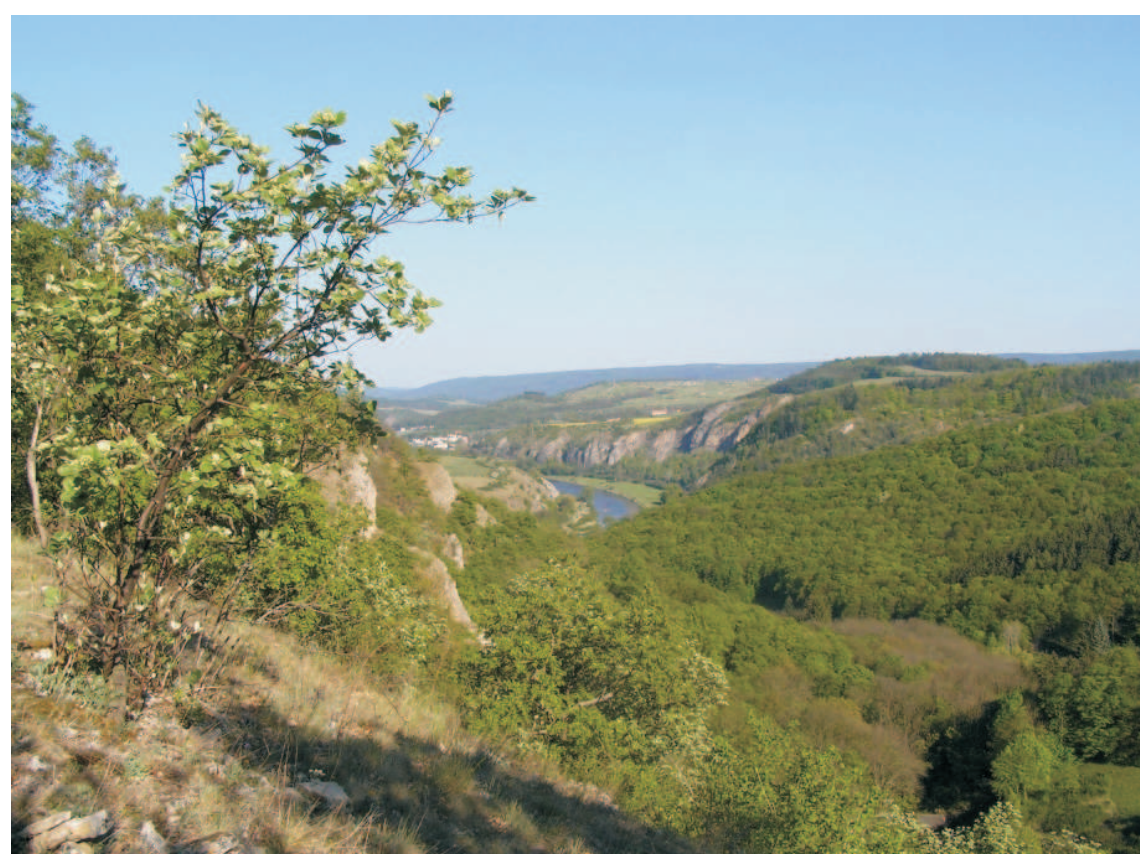
pohled ze stěny Kodské rokle do údolí Berounky

Srbsko a jeho okolí patří k turisticky vyhledávaným místům. Cílem návštěvníků jsou především přírodní zajímavosti Chráněné krajinné oblasti Český kras. Obec leží na hranicích dvou národních přírodních rezervací, Karlštejn a Koda. Za krásami přírody je možné se odtud vydat na trasu naučné stezky Karlštejn. Asi jeden kilometr proti proudu Bubovického potoka se nachází úžlabina, kde voda překonává několik skalních stupňů a vytváří malé vodopády. Za zhlédnutí stojí i Kodská rokle na pravém břehu řeky. Název dostala podle krasového pramenu a prastaré osady Koda. Je zde několik chalup a zbytky středověkého mlýna s rybníčkem. V kodské rokli také najdeme jednu z nejstarších a nejnámějších trampských osad, Údolí děsu. Mezi přírodovědné pozoruhodnosti patří pěnovcové kaskády na potoce, vzniklé vysrážením sladkovodních vápenců (pěnovců) z krasových vod. Skalnaté vápencové svahy jsou domovem vzácných druhů rostlin a živočichů.