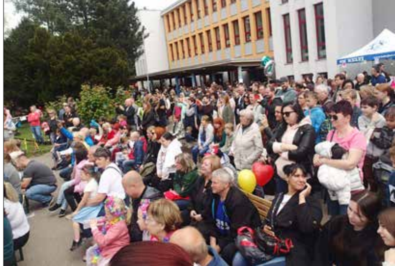
■ Zahradní slavnost se vydařila. Areál školy zaplnily stovky rodičů s dětmi.