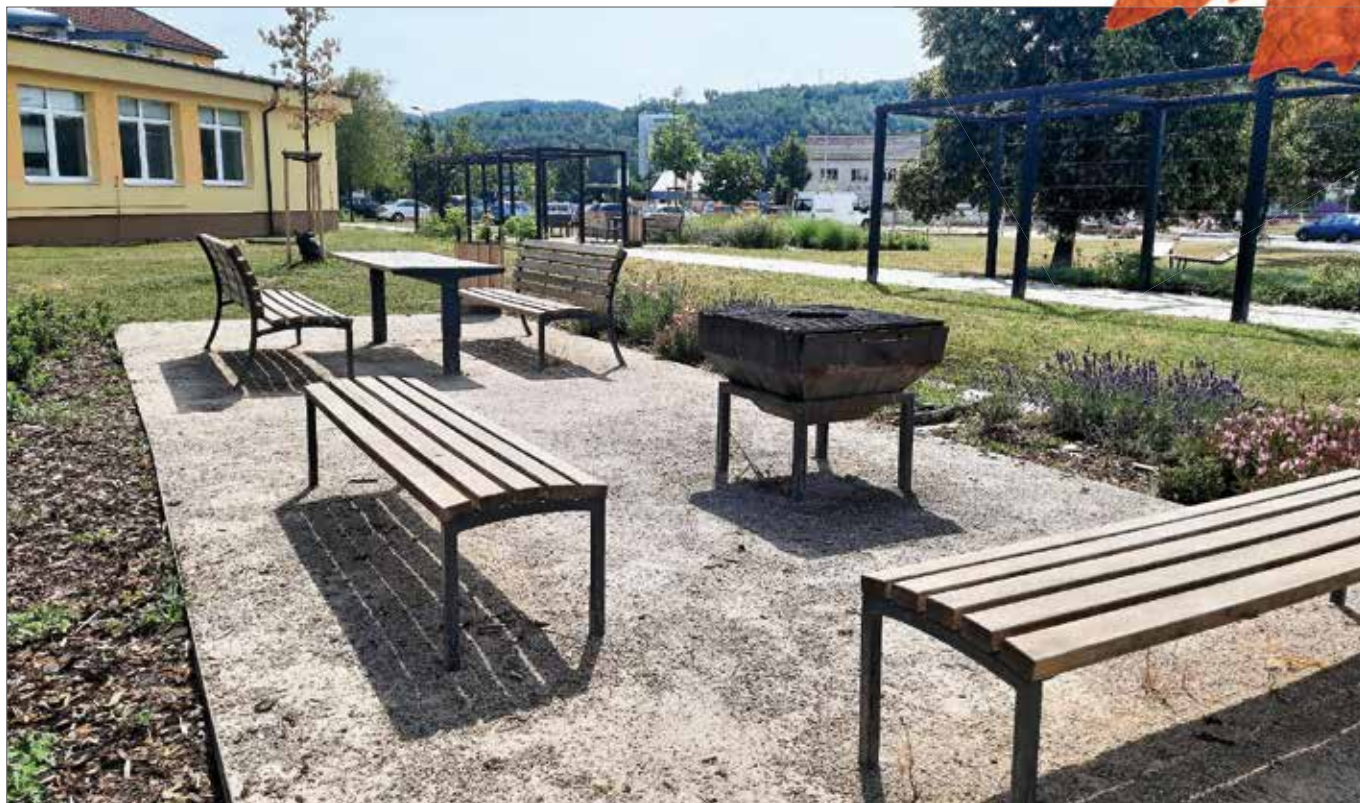
■ Posezení s grilovacím místem vzniklo při rekonstrukci parku u střední zdravotnické školy. Mezi obyvateli Velkého sídliště našel prostor velmi rychle své příznivce.