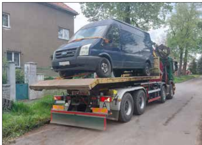
■ V Berouně jsme už úspěšně identifikovali 94 autovraků.

Víte o nějakém odstaveném vraku u nás ve městě? Prostřednictvím platformy ZmapujTo nebo přes aplikaci MUNIPOLIS nám o něm můžete dát vědět. Více na www.zmapujto.cz . ■