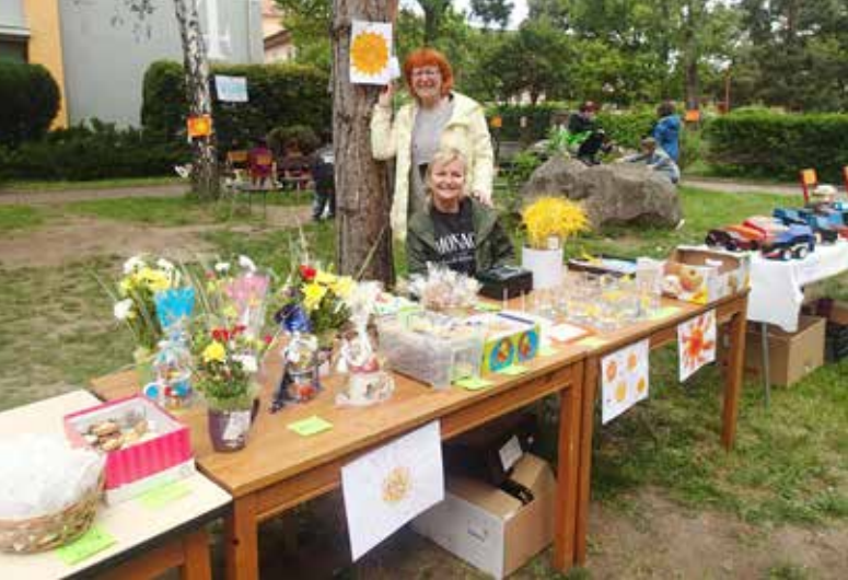
■ Souj stánek s výrobky měla i mateřská školka.