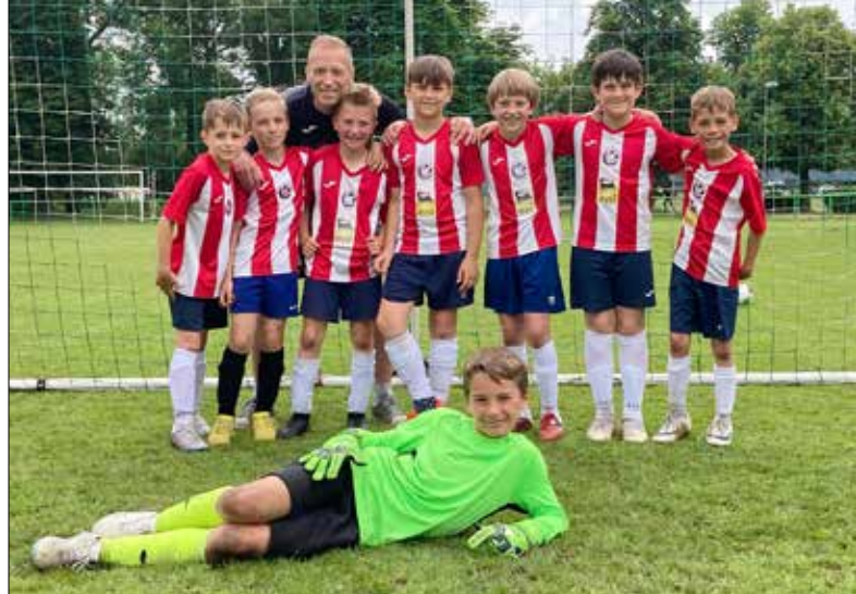
■ Český Lev - Union Beroun prožil úspěšnou sezónu.