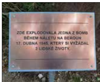
■ Text připomíná tragickou událost ze sklonku 2. světové války.

druhé světové války. Dne 17. dubna 1945 zde totiž explodovala jedna z bomb při náletu na Beroun. Bohužel společně s výbuchem vyhasly i tři životy našich spoluobčanů. Všimaví Berouňáci věděli, že pamětní tabulka v těchto místech již historicky byla. Nieméně se na ní již podepsal zub času, a tak se město rozhodlo vyrobit novou tabulku a tu na místo vrátit. Pokud se při svých procházkách městech vydáte i do těchto míst, určitě se zde zastavte a připomeňte si válečné události, které se bohužel našemu městu nevyhly. ■