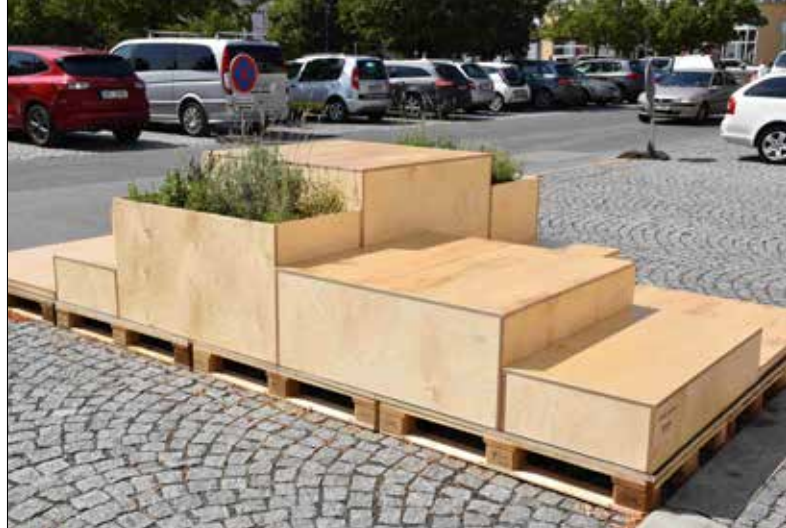
■ Parklety budou na náměstí do září.