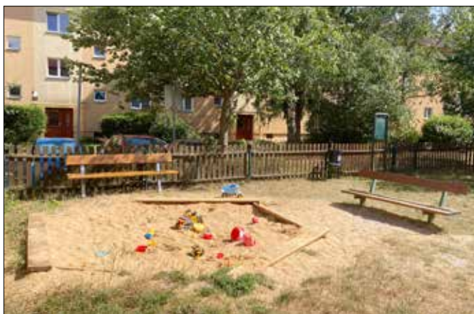
■ Nová lavička na dětském hřišti v ulici Josefa Hory.

Jeden z podnětů se týkal i dětského hřiště v ulici Josefa Hory, kde si maminky přály novou lavičku. Na jejich výzvu jsme zareagovali a dnes je zde již instalovaná nová. ■