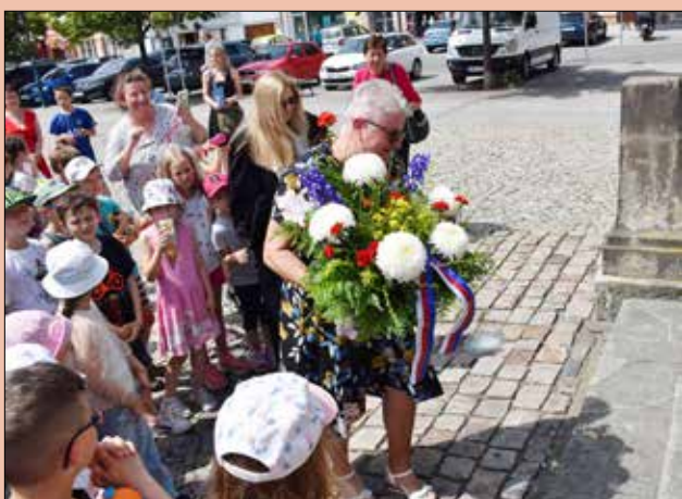
■ Starostka v doprovodu dětí položila květiny u sochy Jana Husa.