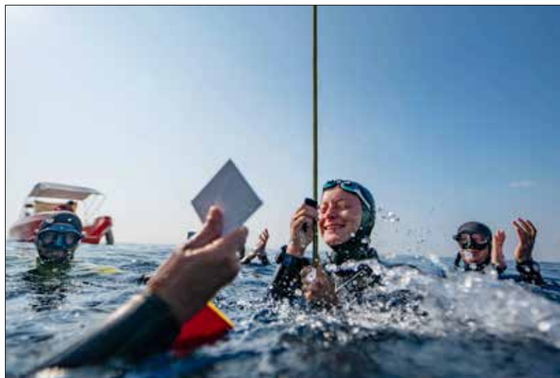
■ Nefalšovaná radost z úspěšného ponoru.