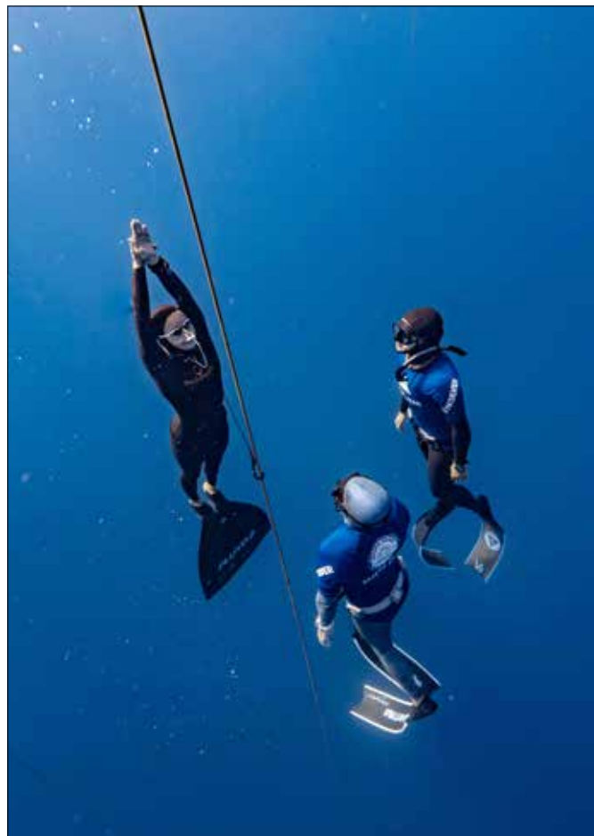
■ Modré hlubiny na Kypru.

Přiznám se ale, že ne vždy se mi to povede. Občas se při cestě na hladinu nechám unést magi-