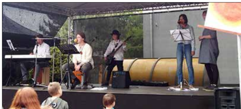
■ Všechny přítomné nadchla jednotlivá vystoupení dětí.