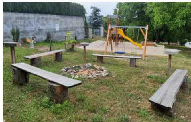
■ K sousedskému setkávání i dětským hrám nabízí další pláček, tentokrát ho najdete Na Cibulce.