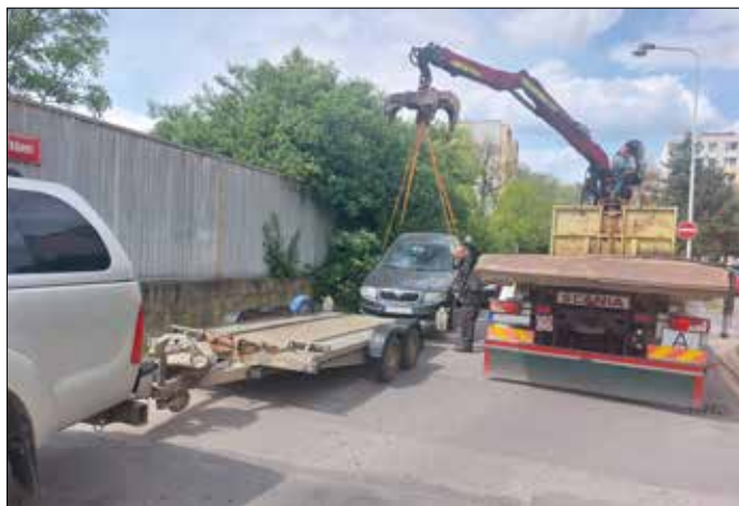
■ Na odstranění vozidla má majitel dva měsíce. Pak přijde na řadu odtah.