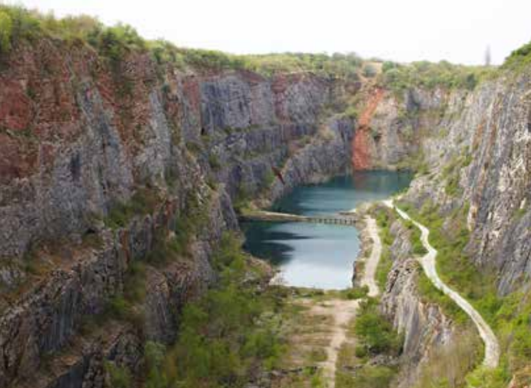
■ Velká Amerika