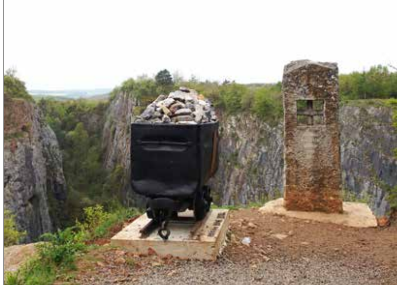
■ Památník u Trestaneckého lomu