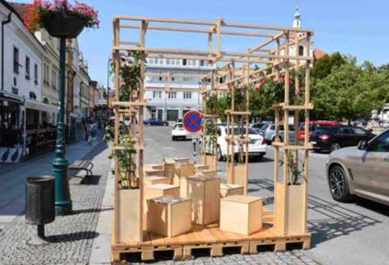
■ Místo parkovacího stání v centru Berouna vyrostly místa pro sezení.