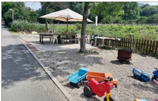
■ Proní komunitní pláček vznikl z iniciativy místních obyvatel v Jiráskově ulici.

Chtěli byste ve vašem okolí také podobný komunitní pláček? Máte vytipované místo? Město Beroun nabízí pomocnou ruku. Pokud u vás tento prostor bude možné vytvořit, město s jeho realizací rádo pomůže. Své návrhy můžete zaslat na podnety@muberoun.cz . ■