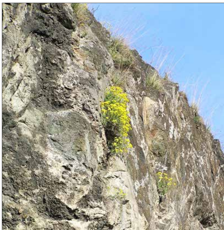
■ Tařice skalní, typická rostlina bývalých lomů