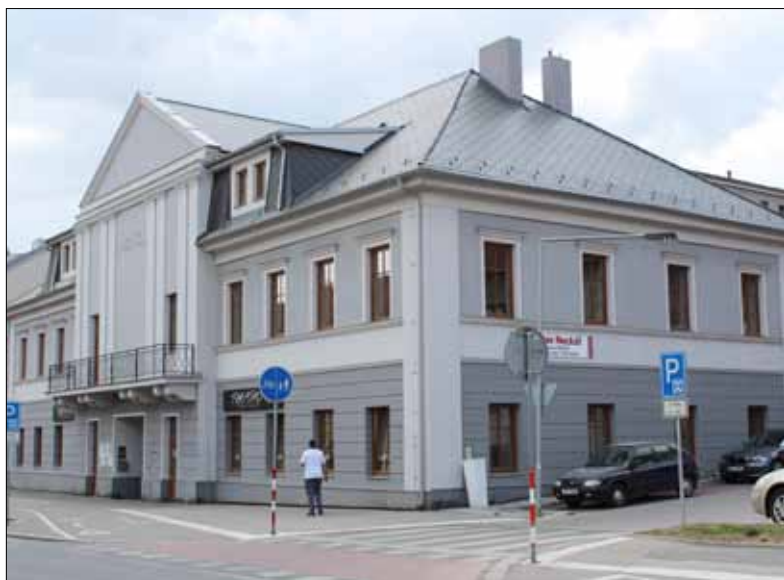
■ Zrekonstruovaný kulturní dům Plzeňka.

Oprava místních komunikací postižených povodněmi a přívalovými dešti v roce 2013 - ulice Ke Kapličce, K Lávce, Na Ptáku, ul. Na Cibulce a Hlinovka v Hostimi.