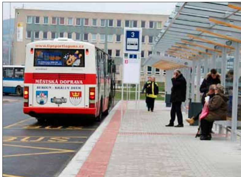
■ Autobusové nádraží se přestěhovalo k hlavnímu vlakovému nádraží.

Rekonstrukce místních komunikací v celkové délce 1 292 m na Velkém sídlišti - ulice Pod Homolkou a v centru města - ulice Okružní.