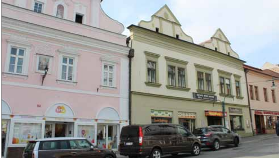
■ Právě v divadelním sále U Tří korun se o říjnu 1918 konala veřejná schůze Národního úboru. Dnes již sál neslouží svému účelu.