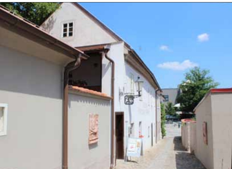
■ Muzeum berounské keramiky

Vybudování muzea berounské keramiky a archeologie ve stávajícím objektu v centru Berouna. Revitalizace přilehlé zahrady, která doplnila interiéry muzea o prostor exteriérů a umožnila pořádání krátkodobých výstav a setkání pod širým nebem.