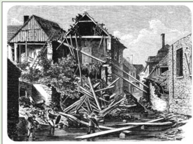
Důsledky velké povodně roku 1872 ve Slapské ulici (dobová kresba)

Po protržení královského rybníka dorazila vlna o výšce dvou metrů k Berounu. Proud byl tak silný, že strhl patnáct domů, nebo je podmáčel tak, že se zborstily. Nejen Beroun ale celou kotlinu tato nenápadná říčka proměnila v jedno velké jezero. Měla takovou sílu, že na krátký čas obrátila tok Berounky, do níž se vlévala zvláštním způsobem proti jejímu toku. Na rozloučenou ještě povodeň způsobila ve městě epidemii cholery. Po této povodni a zejména po povodni z roku 1890 se začalo konečně uvažovat o tom, jak oběma řekám alespoň zčásti zabránit v páchání škod. (jt) ■