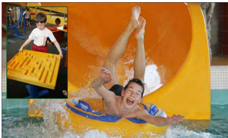
■ O jarních prázdninách mohou děti navštívit berounskou Tipsport lagunu nebo třeba liberecký IQ park.

Anglický jazyk v první třídě vyučuje v Berouně například i Jungmannova základní škola. Také základní škola na Wagnerově náměstí, kde se dosud vyučuje angličtina od 3. třídy, zvažuje zavedení tohoto jazyka už u prvňáčků.