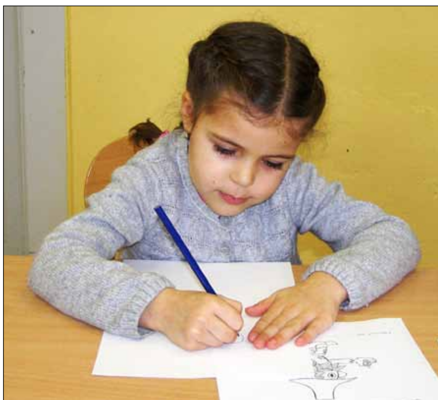
Předškoláci v Berouně už mají zápisy do prvních tříd za sebou. Zúčastnilo se jich 265 dětí. Mezi nimi i dívka na snímku, která se přišla zapsat do Základní školy na Wagnerově náměstí.