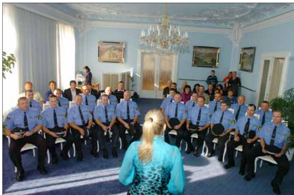
■ Městská policie Beroun si ve čtvrtek 11. října na slavnostním ceremoniálu připomněla dvacáté výročí svého založení. Více na str. 2.

Linka C20 - bude vedena z Králova Dvora Plzeňkou k Černému koni a dále po své trase. Bude zastavovat na zastávkách Beroun, sídliště a Plzeňka.