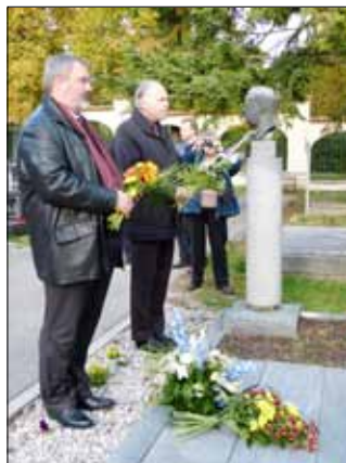
■ Pietní akt se u hrobu Václava Talicha na městském hřbitově konal v úterý 9. října. ■

cích spontánně završilo koncert zpěvem české národní hymny,“