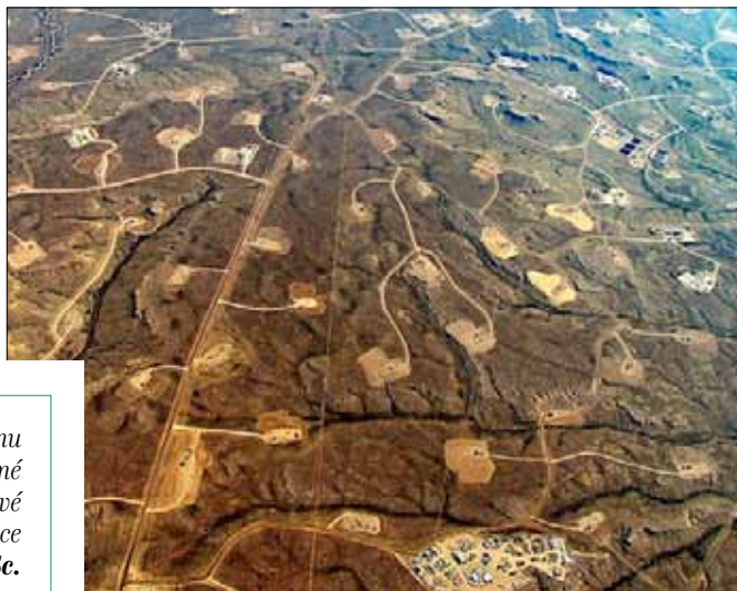
Měsíční krajina - tak vypadají vrty v praxi.

Nejdříve se vrtá svislý vrt do 2 až 4 kilometrů. Následuje kilometr dlouhý vodorovný vrt. Pomocí výbuchů se ve vodorovné části vytvoří síť trhlin. Do nich se ženou miliony litrů vody a desítky tun toxické chemie pomocí desítek naftových agregátů. Pro jeden vrt je třeba až 3 hektary plochy, pro těžbu jsou třeba desítky, stovky vrtů. ■