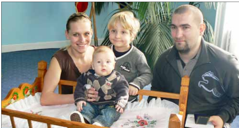
■ Prvního letošního Vítání berounských občánků se 7. března zúčastnilo 17 dětí.

INVESTICE DO VAŠÍ BUDOUCNOSTI SPOLUFINANCOVÁNO EVROPSKOU UNIÍ Z EVROPSKÉHO FONDU PRO REGIONÁLNÍ ROZVOJ