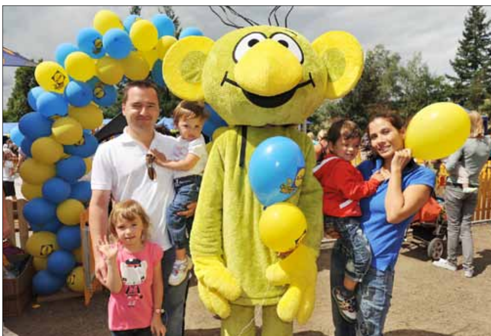
■ Historicky první Rákosníčkově hřiště na území Čech bylo v neděli 15. července slavnostně otevřeno v Berouně v Košťálkové ulici. Více na straně 10.