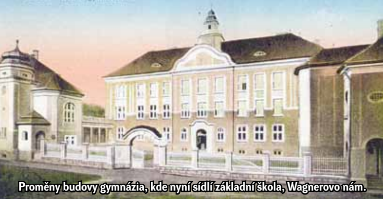
Proměny budovy gymnázia, kde nyní sídlí základní škola, Wagnerovo nám.