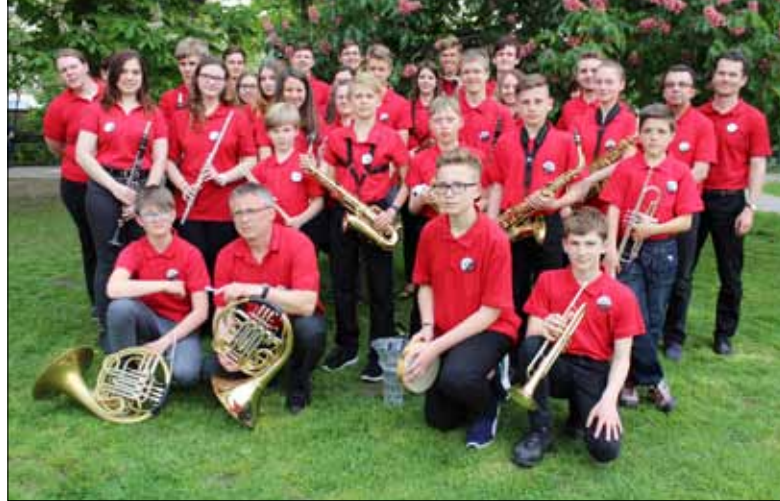
■ Orchestr ZUŠ V. Talicha v Berouně Oddechova.

■ Průvod poselstva vévody Bavorského, který se stal již neodmyslitelnou součástí Královského průvodu, se i letos na své cestě zastaví v Berouně. Nenechte si proto ujít skvělou atmosféru, dobové kostýmy a zajímavý program. Příjezd průvodu do centra Berouna se uskuteční v sobotu 2. 6. Následovat bude program v pivovaru Berounský medvěd. Průvod zakončí svou cestu v sobotu večer na Tetíně. V neděli se pak vydá do Karlštejna, kde se připojí ke Královskému průvodu. Zde se uskuteční neformální setkání představitelů obcí. ■