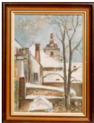
■ Zimní Plzeňská brána.