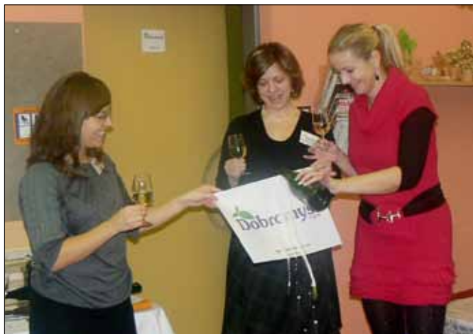
Příspěvek získala i Asociace rodičů a přátel zdravotně postižených dětí v ČR o.s. - Klub Klubičko Beroun, která se mezitím přejmenovala na Dobromysl. Nové logo pokřtili na Dni otevřených dveří 15. února.

Příspěvek na náklady na prevenci sociálně patologic- kých jevů byl udělen jedinému žadateli a to ve výši 5000 korun na projekt Zdravá škola - zdravé vztahy. Na realizaci projektu se podílí bez nároku na honorář zaměstnanec berounského úřa- du. ■