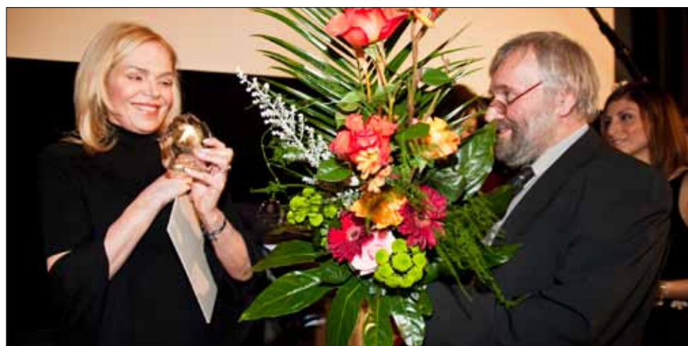
■ Udílení cen Trilobit Beroun 2011 se zúčastnila i někdejší první dáma Dagmar Havlová, která zde za zesnulého manžela převzala Cenu Josefa Škvoreckého. Více na straně 11.

„Rádi bychom, aby se v areálu konaly například sportovní či