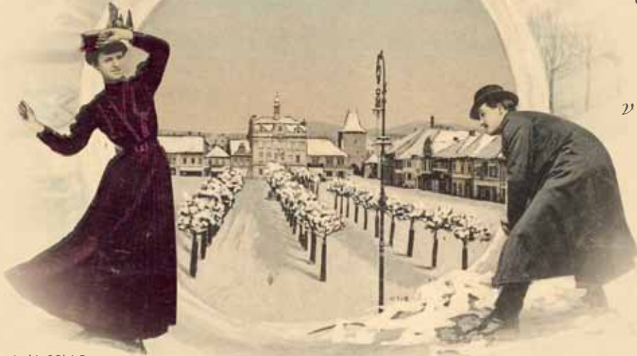
Archiv SOKA Beroun

Spokojené Vánoce, v novém roce hodně zdraví, lásky a radosti ze života.