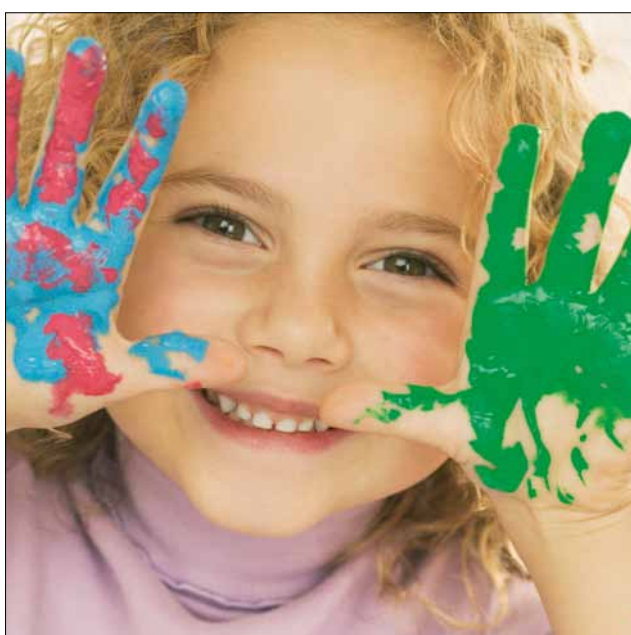
■ Zápisy prvňáčků se v berounských základních školách uskuteční v polovině února: v pátek 10. 2. od 14 do 17 a v sobotu 11. 2. od 9 do 11 hodin.