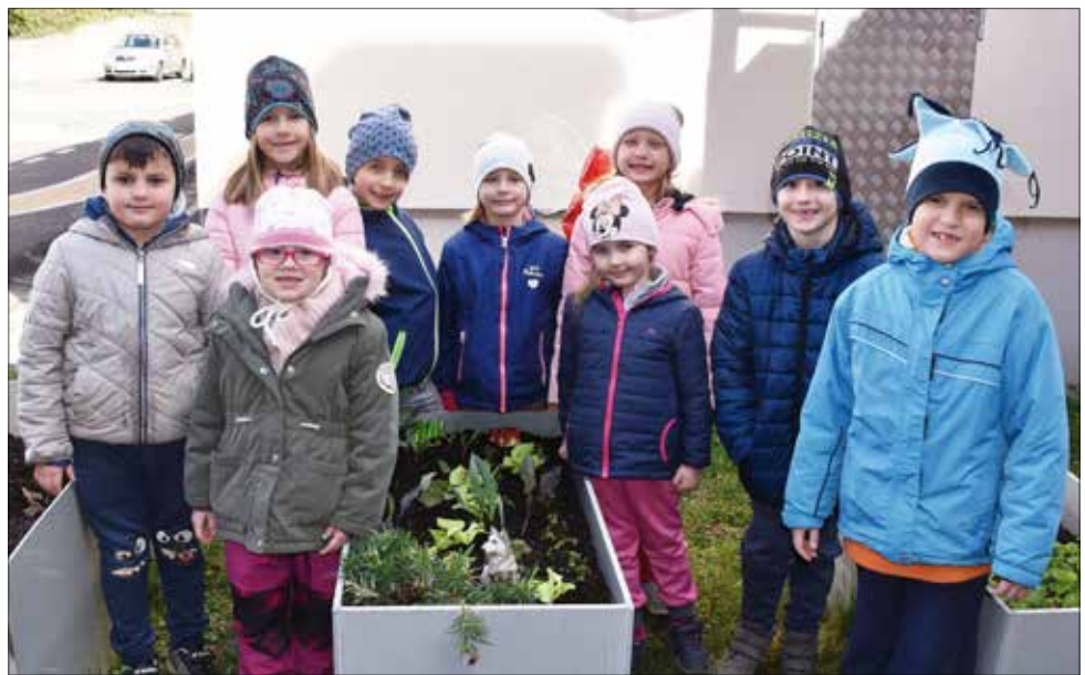
■ V mateřské škole v Touární ulici si děti pěstují kořtiny i zeleninu. Třída Štěňat se nám pochlubila svým záhonkem, kde mají zasazený salát, kedlubny i ředkvičky. ■

V druhé polovině dubna se podařilo městu Beroun zprovoznit ubytování pro ukrajinské uprchlíky v berounském kempu. Zde mají k dispozici osm obytných buněk, dále kuchyňku a využívat mohou zdejší sociální zařízení. Od května začne fungovat také přechodné ubytování pro Ukrajince v bývalých kasárnách. ■