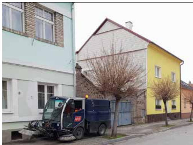
■ Seznam blokového čištění najdete na stránkách města Beroun nebo pro aktuální měsíc v Radničním listu.