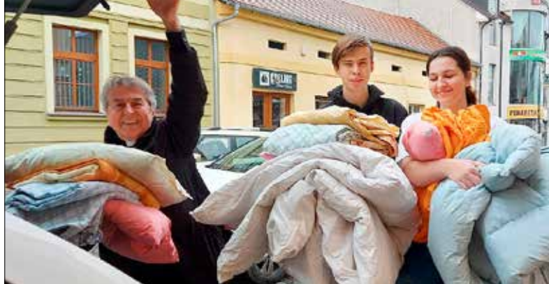
■ V Centru pomoci přiložili ruku k dílu i studenti místních středních škol.