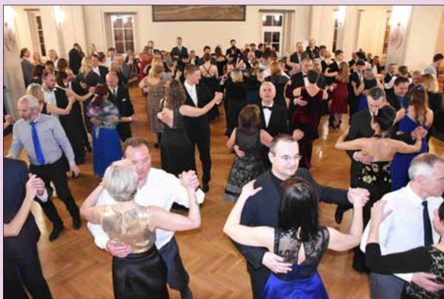
■ Jak se opět ukázalo, Berouňané tanec milují. Na parketu bylo pořád plno, a to už od prvních taktů, které kapela začala hrát.