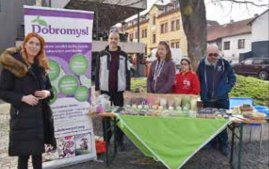
■ Na náměstí Joachima Barranda se v rámci Velikonoc představili i zástupci sociálních a návazných služeb.