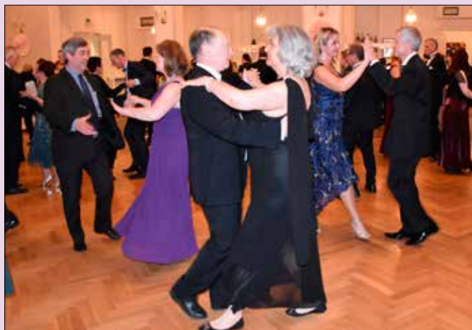
■ Městský bál byl vždy tradičním vyvrcholením plesové sezóny v Berouně. Ačkoliv byl přesunut kvůli koronavirovým opatřením až na duben, lidé si ho nenechali ujít.

Do sálu Kulturního domu Plzeňka se po koronavirové pauze vrátil Městský bál, který mělo na starost Městské kulturní centrum. A návrat to byl velkolepý. Vstupenky byly téměř ihned vyprodané a tanečníci se skutečně měli na co těšit. K tanci jim totiž hrála kapela MoonDance Orchestra Martina Kumžáka, kterou znáte z pořadu StarDance. Ples měl i charitativní podtext. Výtěžek z tomboly totiž putuje na podporu ukrajinských uprchlíků.