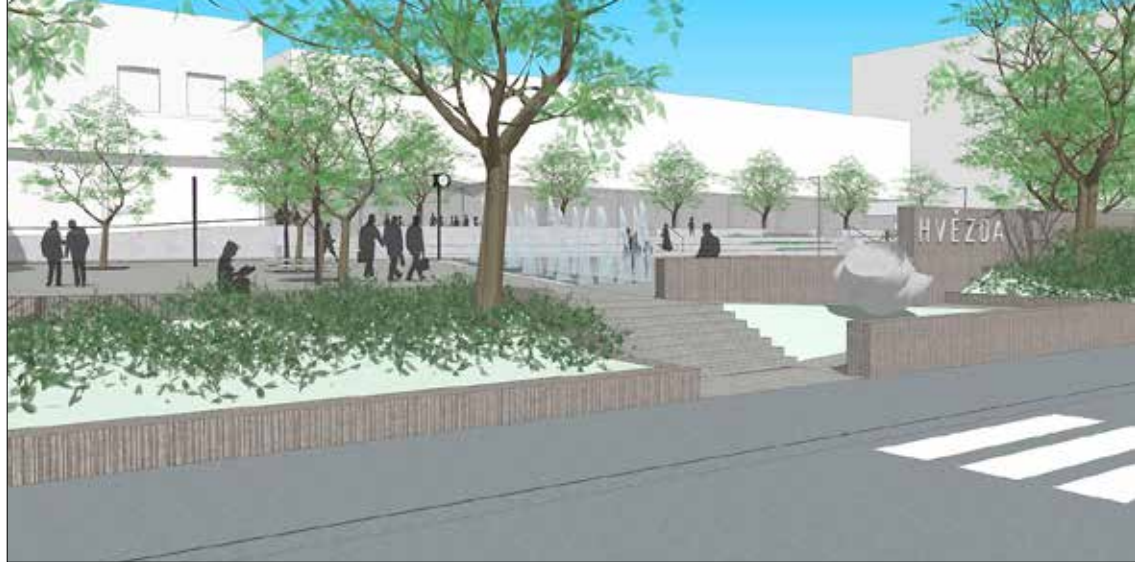
■ Vizualizace rekonstrukce prostranství před Hožďdou. V rámci projektové dokumentace došlo následně k drobným úpravám.