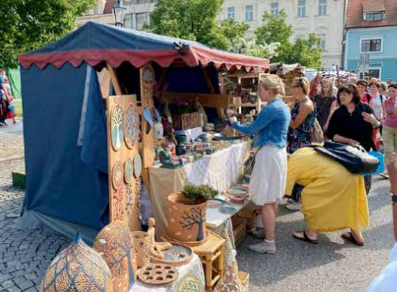
■ Hlavní zastoupení budou mít tradičně keramici.