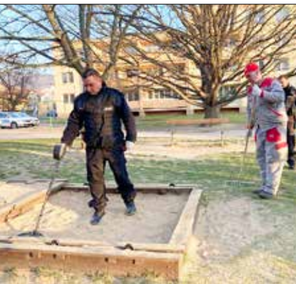
■ Při kontrole se používal i detektor kovů.

První kontrola proběhla na hřišti Na Parkáně, odkud jsou i naše fotografie. Vedle pískovišť prošly prohlídkou i dopadové plochy u herních prvků. Pomocí detektoru kovů se podařilo najít několik ostrých předmětů jako např. šrouby, zátky od piva, injekční jehlu nebo víčka od konzerv. Mezi častými nálezy byly i střepy od rozbítených lahví. Největší práci měli strážníci a preventisté na Městské hoře, kde jsou pískoviště největší. ■