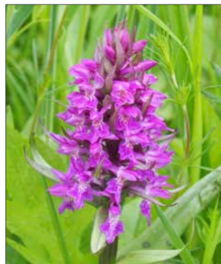
■ Prstbátec májový

vy, s typickým teplomilným dubem pýřitým nebo-li šipákem. Našli bychom tu řadu orchidejí, kterých roste v této oblasti krasu skoro dvacet druhů. Velmi pěkné jsou i jiné rostliny, třemdava bílá, kamejka modronachová nebo krásně vonící zvonovec liliolistý, uvedený v seznamu chráněných druhů Evropské unie. V habrových doubravách bychom mohli obdivovat lilii zlatohlavou nebo okrotici bílou či červenou, která se vyskytuje také v bučinách. Potěšitelné je, že se v posledních letech zase objevily některé vzácné rostliny, které v minulosti vymizely. Je to například orchidej střevčnick pantořlíček. V Českém krasu se dokonce také vyskytují druhy, které nerostou nikde jinde u nás ani ve světě. Říká se jim endemité a patří k nim dřevina jeřáb krasový a barrandienský. Všechny druhy, které jsem uváděl, mají rády teplo, ale v Krasu najdeme i rostliny, pro něž jsou vhodnější chladnější stinné vápencové srázy. Mezi ně patří například hvozdík sivý nebo lomikámen trsnatý. Emil Šnidauf ■