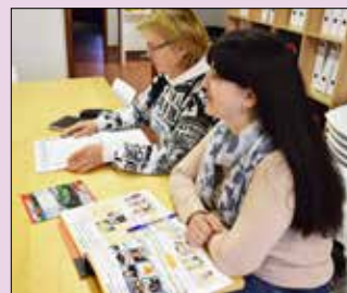
■ Ukrajinky mají k dispozici učebnice, které pedagožky velmi chválí.

Samotné kurzy jsou rozděleny do pěti skupin, každá z nich má nejvýše deset studentů. Výuka každé skupiny se koná dvakrát týdně. Ačkoli se již kurzy rozběhly, stále je několik volných míst a je možné se i nadále přihlásit. Zájemci získají bližší informace přímo v Jazykové škole Jíll nebo v Centru pomoci v České ulici. ■