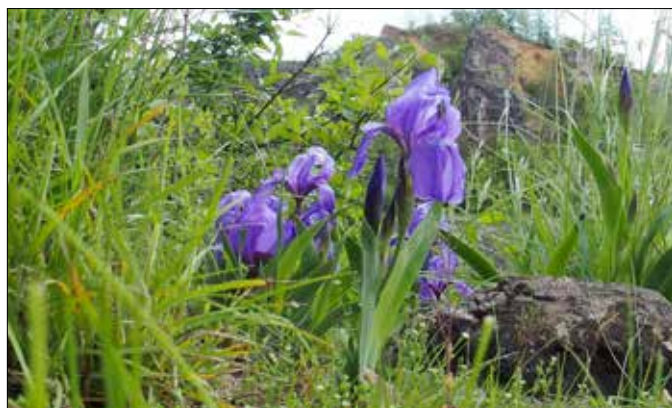
■ Kosatec bezlistý