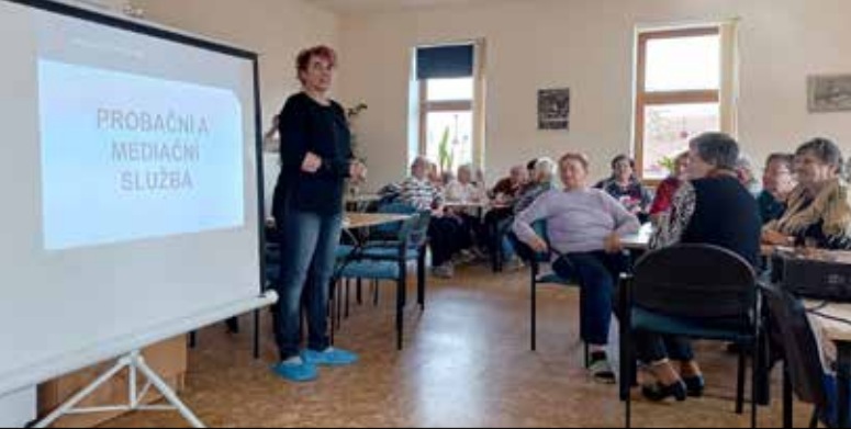
■ Probační a mediační služba prezentovala svou činnost.