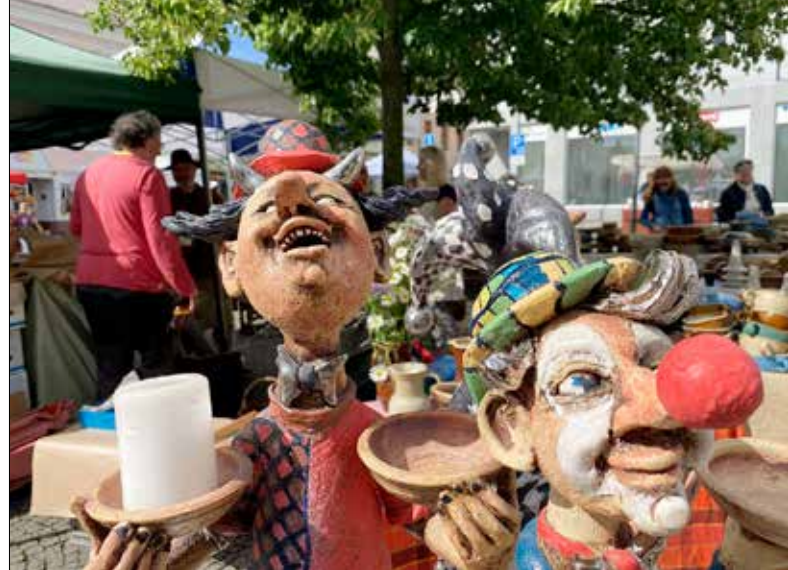
■ K vidění bude opět uživatelská i okrasná keramika