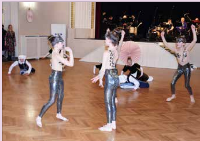
■ O předtančení se postaraly děti ze skupiny R.A.K. Beroun, která v letošním roce slaví 30. výročí svého založení.