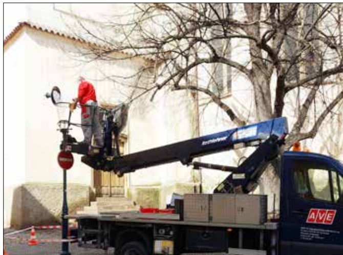
■ V průběhu dubna probíhalo také čištění lamp veřejného osvětlení.

Duben je z pohledu zaměstnanců AVE CZ především měsícem jarního úklidu. A podle toho také vypadala podstatná náplň jejich činnosti. Na ulicích jste tak mohli potkávat jak čističí vozy, tak i samotné pracovníky s košťaty a lopatami, jak likvidují pozůstatky zimy. Ale AVE CZ se po dohodě s městem pustila i do stavební činnosti, jak se můžete přesvědčit na fotografiích. Zároveň pracovníci řešili také podněty občanů, kteří kontaktují město prostřednictvím aplikace ZmapujTo, kontaktního formuláře na webu města nebo emailem podnety@muberoun.cz. ■