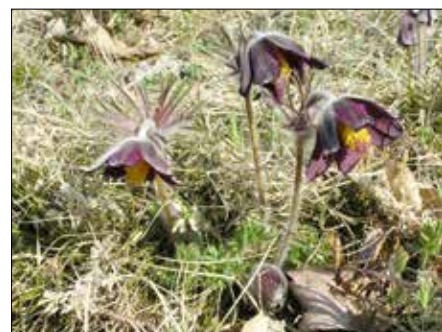
■ Koniklec luční český