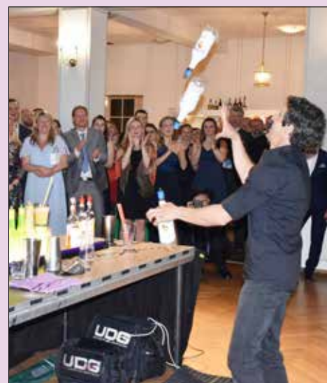
■ Vyvrcholením doprovodného programu byla bar-manská šou, při které před ušaslým publikem létaly ozduchem lahve a sklenice.