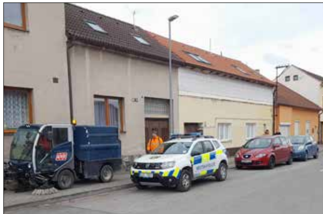
■ Jarní měsíce jsou ve znamení čištění ulic po zimě. V Berouně máme více než 70 km silnic a téměř dvojnásobek chodníků. Jejich vyčištění tedy určitý čas zabere.