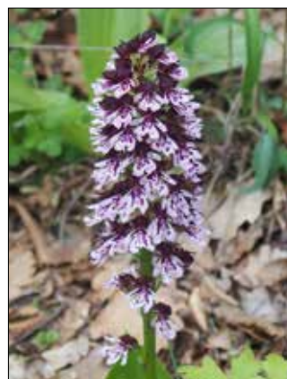
■ Vstavač nachový

Typickým ekosystémem jsou v Českém krasu šipákové doubra-