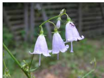
■ Zvonovec liliolistý

vy, s typickým teplomilným dubem pýřitým nebo-li šipákem. Našli bychom tu řadu orchidejí, kterých roste v této oblasti krasu skoro dvacet druhů. Velmi pěkné jsou i jiné rostliny, třemdava bílá, kamejka modronachová nebo krásně vonící zvonovec liliolistý, uvedený v seznamu chráněných druhů Evropské unie. V habrových doubravách bychom mohli obdivovat lilii zlatohlavou nebo okrotici bílou či červenou, která se vyskytuje také v bučinách. Potěšitelné je, že se v posledních letech zase objevily některé vzácné rostliny, které v minulosti vymizely. Je to například orchidej střevčnick pantořlíček. V Českém krasu se dokonce také vyskytují druhy, které nerostou nikde jinde u nás ani ve světě. Říká se jim endemité a patří k nim dřevina jeřáb krasový a barrandienský. Všechny druhy, které jsem uváděl, mají rády teplo, ale v Krasu najdeme i rostliny, pro něž jsou vhodnější chladnější stinné vápencové srázy. Mezi ně patří například hvozdík sivý nebo lomikámen trsnatý. Emil Šnidauf ■