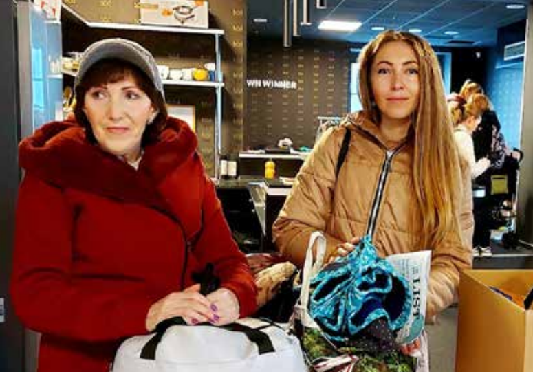
■ V České ulici nenajdou uprchlíci jen potraviny, hygienické prostředky nebo deky, ale také zde získají důležité informace.