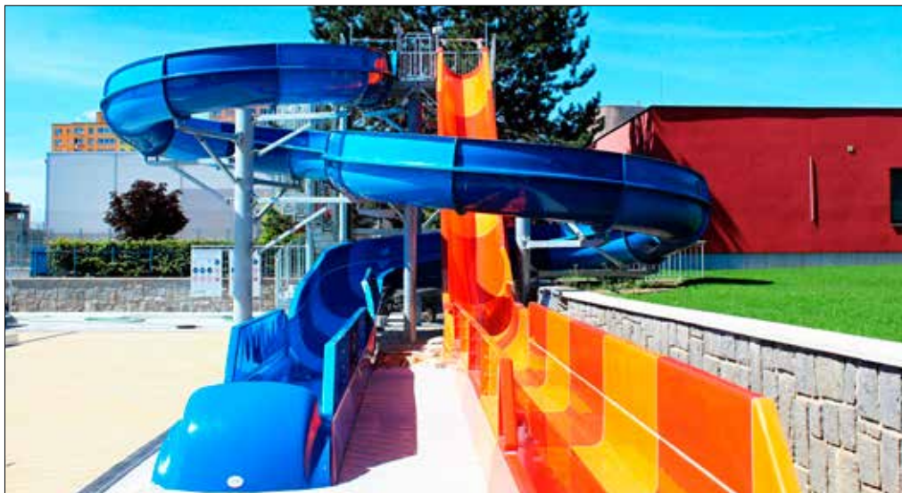
■ Berounský venkovní bazén prošel první etapou velké rekonstrukce.

Já mám samozřejmě velký vztah k aquaparku, protože jsem u jeho provozování již 14 let. Ale musím se přiznat, že ve velké oblibě mám i letní koupaliště. Tam jsme měli tu možnost být už u projektové fáze a pak samotné rekonstrukce koupaliště, což pro nás jakožto provozovatele bylo velmi přínosné a odměnou nám jsou dny, kdy vidíme plně koupaliště spokojených návštěvníků. ■