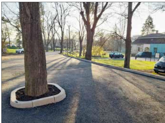
■ Návštěvníci městského hřbitova si určitě všimli nově vyasfaltovaného porouchu před areálem. Město tak vyšlo vstříc žádostem občanů.