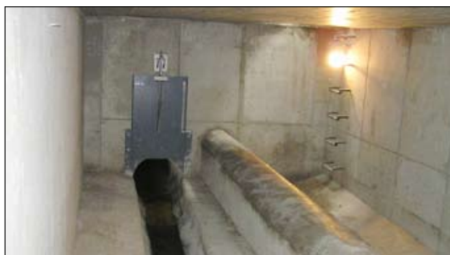
Odlehčovací stoka v Plzeňské ulici slouží k odlehčení průtoku vod do řeky Litavky při přívalových deštích.