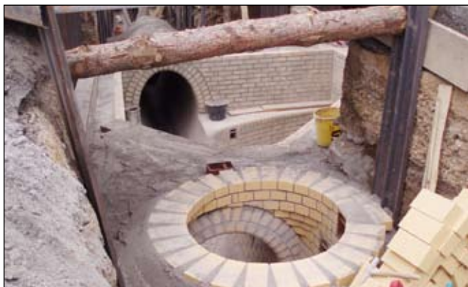
Zděný vstup z kanalizačních cihel z Plzeňské ulice do zděného úseku vejčité stoky pod Plzeňskou ulicí.

V roce 2007 byl dokončen projekt Rozšíření kanalizace v aglomeraci Beroun za řádově 400 milionů korun, přičemž příspěvek z Fondu soudržnosti EU by měl přesáhnout rekordních 253 milionů korun. Celková délka vybudované kanalizace činila 16,3 kilometru a nově se na ni připojilo takřka 3,5 tisíc lidí. Samotná realizace trvala 16 měsíců. Akce byla výjimečná i tím, že při pokládce nového kanalizačního řadu bylo nutné překřížit tok řek Berounky a Litavky, nové potrubí vede i pod dálnicí D5 Praha - Plzeň. Motoristy asi nejvíce potrápilo budování kanalizačních řadů na Plzeňské ulici, která je hlavním komunikačním tahem přes město. Prostřednictvím našich snímků si nyní můžete prohlédnout, jak moderní kanalizační síť pod berounskou dopravní tepnou vypadá.