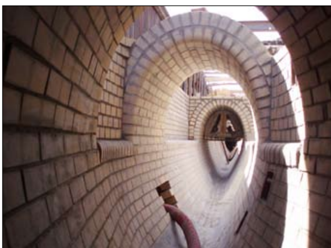
Pohled do vejčité stoky pod Plzeňskou ulicí zděné z kanalizačních cihel. Žlábek je proveden z taveného čediče, který je odolný vůči abrazi materiálu. V levé části stoky je vidět provizorní připojení nově zděného úseku. V současné době již touto stokou protéká splašková voda a provizorní připojení je zazděné.