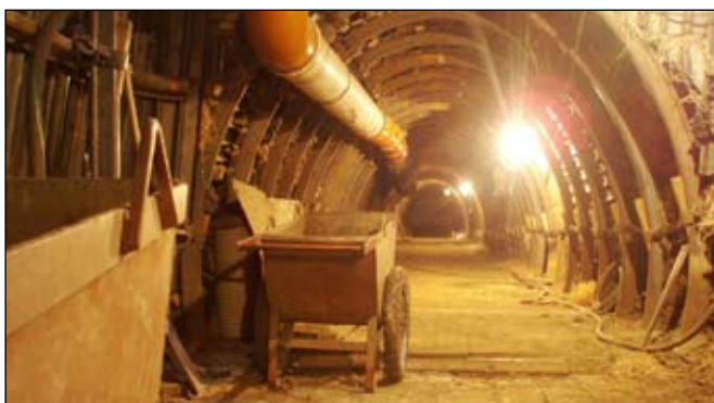
Pohled na část raženého úseku na soce F pod Plzeňskou ulicí, v místě autobusové zastávky u pily Francl.