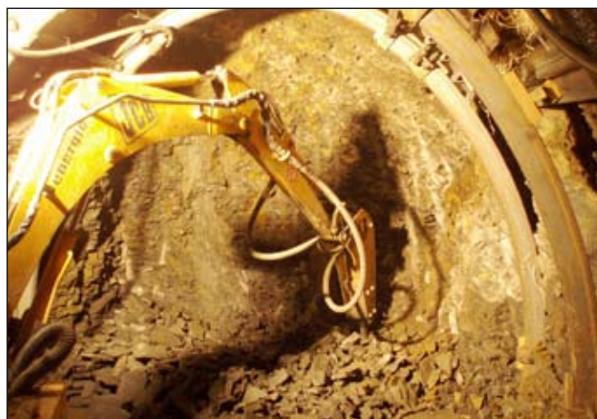
Na raženém úseku kanalizace v zatáčce u 2. základní školy směrem k Delvítě se nacházely velmi tvrdé horniny. Bylo proto nutné použít výkonné mechanismy.