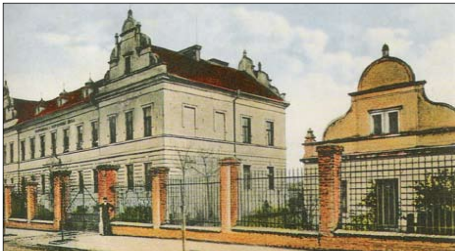
Jednou z významných akcí roku 1908 bylo dokončení stavby Hospodářské a hospodyňské školy ve Svatojánské ulici na Závodí. Přehlédnout ji v té době nebylo možné. Vzhledem k řídké zástavbě této části města působila totiž nová školní budova uprostřed nezastavěných luk značně osaměle.

■ Pan Dr. Kotík činí návrh, aby město svolilo k zařizování zavádění světla na splátky , aby se rozšíření osvětlování docíleno bylo - (s dohodnutím se s domácím).