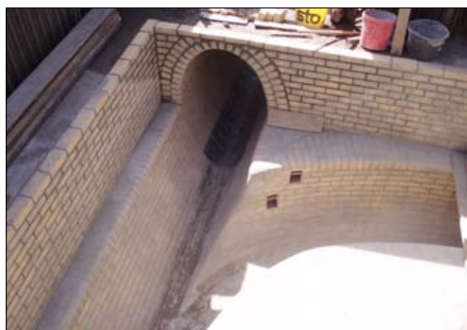
Spojná komora na rohu ulic Plzeňská a Bratří Nejedlých řeší soutok dvou stok rozdílného profilu.