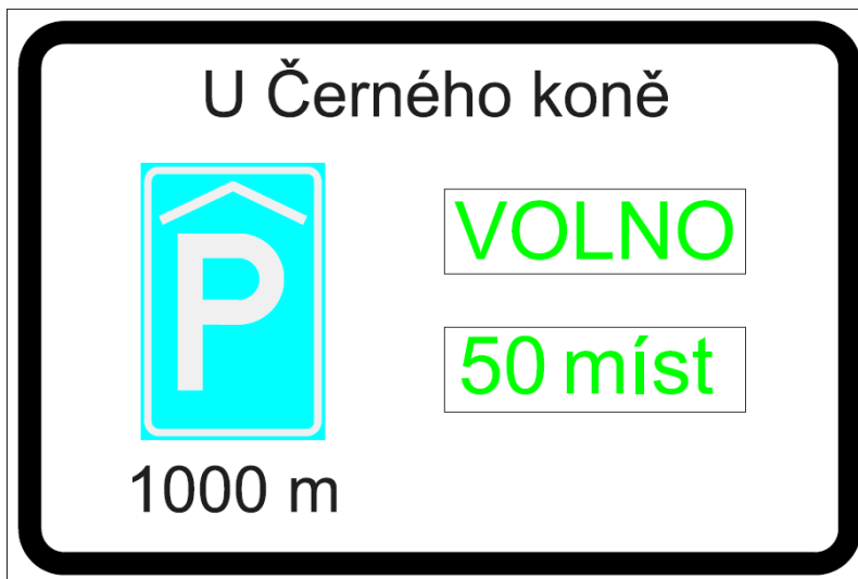
Obrázek 2 Příklad návrhu ZPI o obsazenosti parkovacího domu U Černého koně

mezi parkovacím systémem domu a osazenými PDZ. S ohledem na malé přenosové nároky doporučujeme použití bezdrátového systému propojení. Ostatní osazené dopravní značení a informační systémy ostatních parkovacích ploch považujeme za dostatečné.