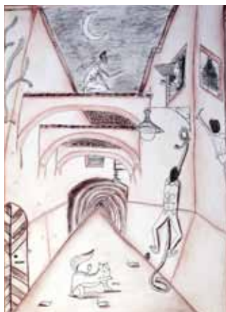
Kresba Nikolý Nové Julie a Romea ze Slapské ulice.

vystaveny a poté zde v rámci Národního zahájení EHD proběhne 8. září celostátní vyhlášení vítězů.