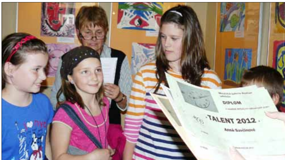
■ Své vítěze zná další ročník soutěže Talent 2012. Porota vybírala z takřka tří set uměleckých děl. Více na straně 9.