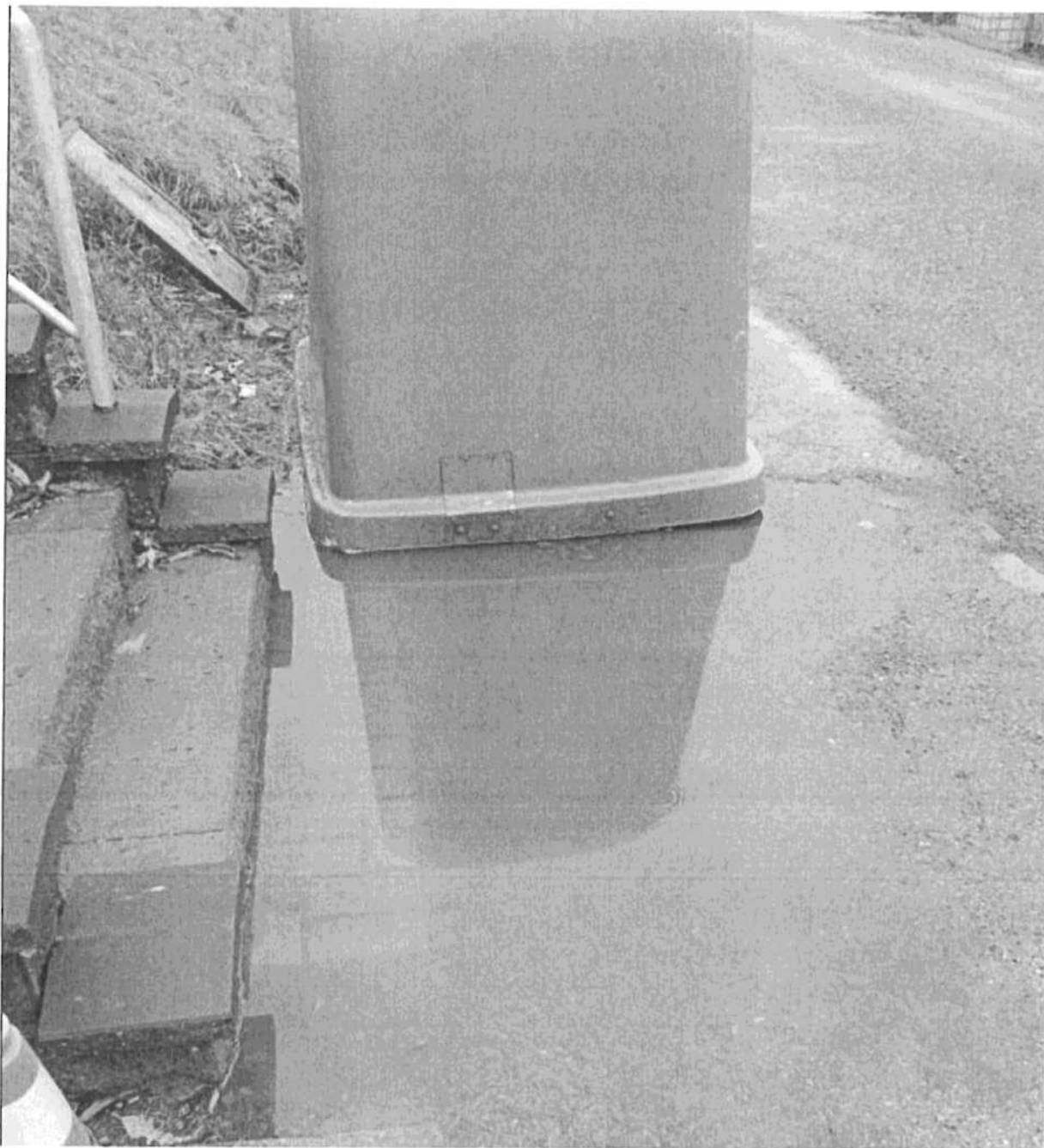
Bod 76 - Foto 1 - 3. – prostor u schodů č.p. 56 ČS. armáda